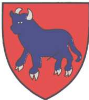
Herb Drzewieckich i Głuskich CIOŁEK